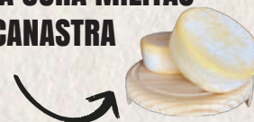
MEIA CURA MILITAO DA CANASTRA