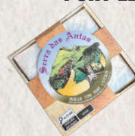
PONT LEVEQUE SERRA DAS ANTAS