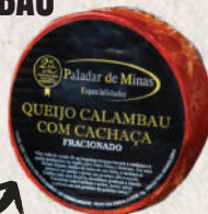
QUEIJO CALAMBAU COM CACHAÇA