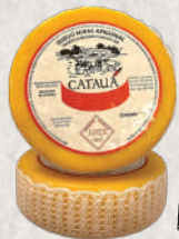
QUEIJO CATAUA (JERSEY)