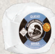
QUEIJO BRISA R$ 88,00 kg Preço de venda