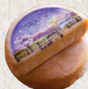
QUEIJO CANASTRA CAPELA VELHA