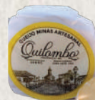
QUEIJO QUILOMBO MOFO BRANCO