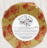
LUA CHEIA SERRA DAS ANTAS