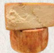
QUEIJO CURADO TULHA