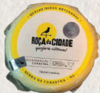
QUEIJO CANASTRA ROÇA CIDADE (SISBI)