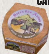
CAMEMBERT SERRA DAS ANTAS