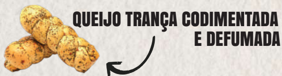
QUEIJO TRANÇA CODIMENTADA E DEFUMADA