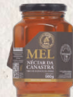
MEL DA CANASTRA