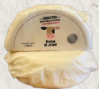
PINGO DE AMOR / TRILHA DA PEDRA